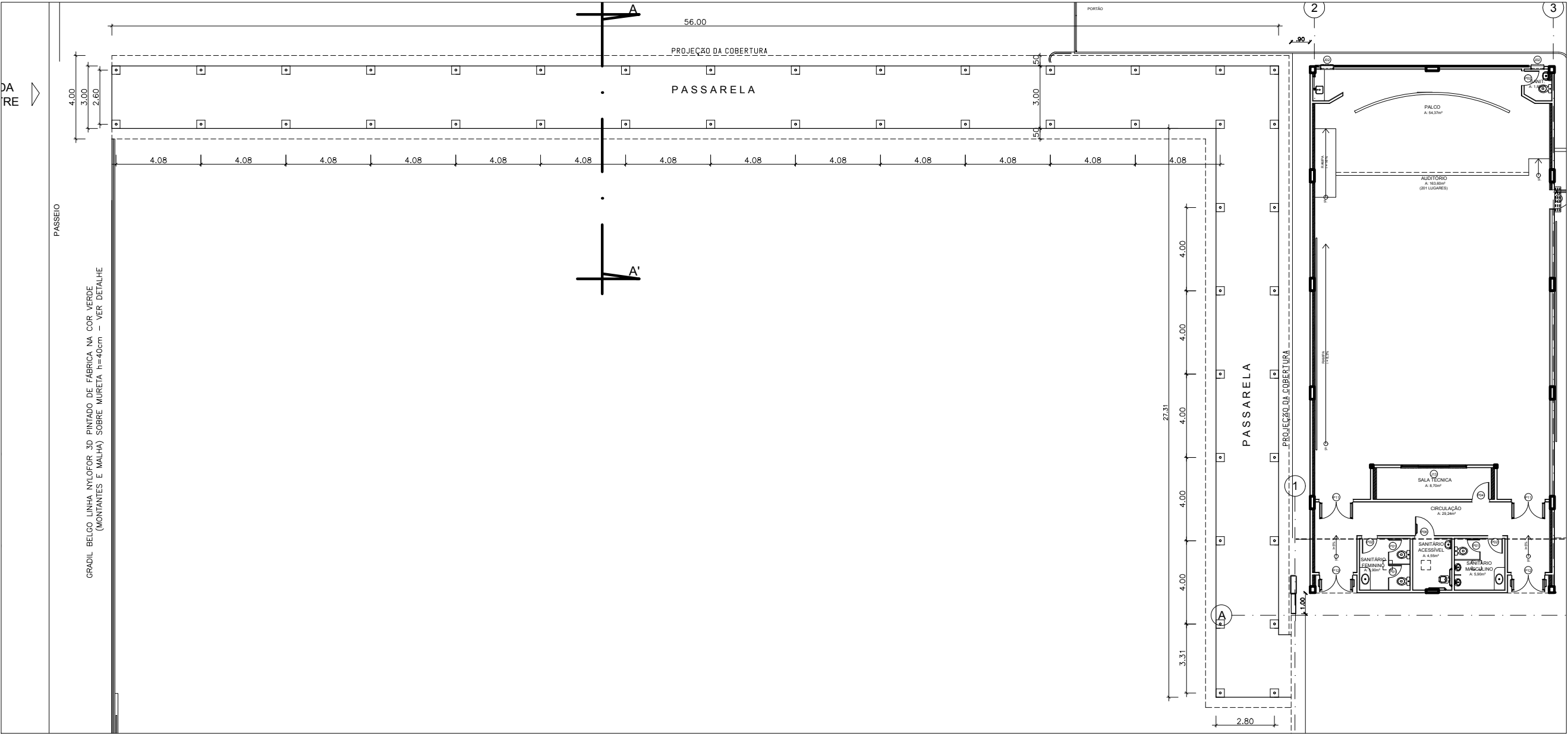
PLANTA BAIXA ESCALA 1/125